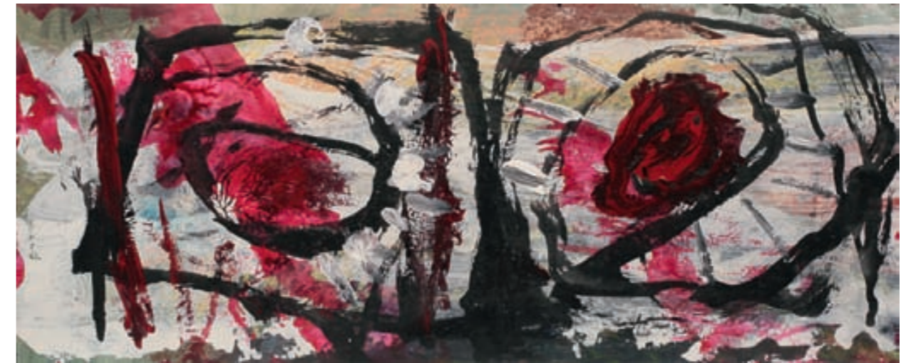
KOMPOSITION | Kompozycja, MISCHTECHNIK, PAPIER | technika mieszana, papier, 15x37, 2008