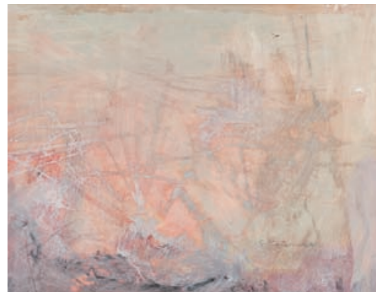
25 KOMPOSITION IN PASTELL | Kompozycja w pastelach, PAPIER, GOUACHE | papier, gwasz, 23x29, 2001 Privatsammlung | wł. prywatna