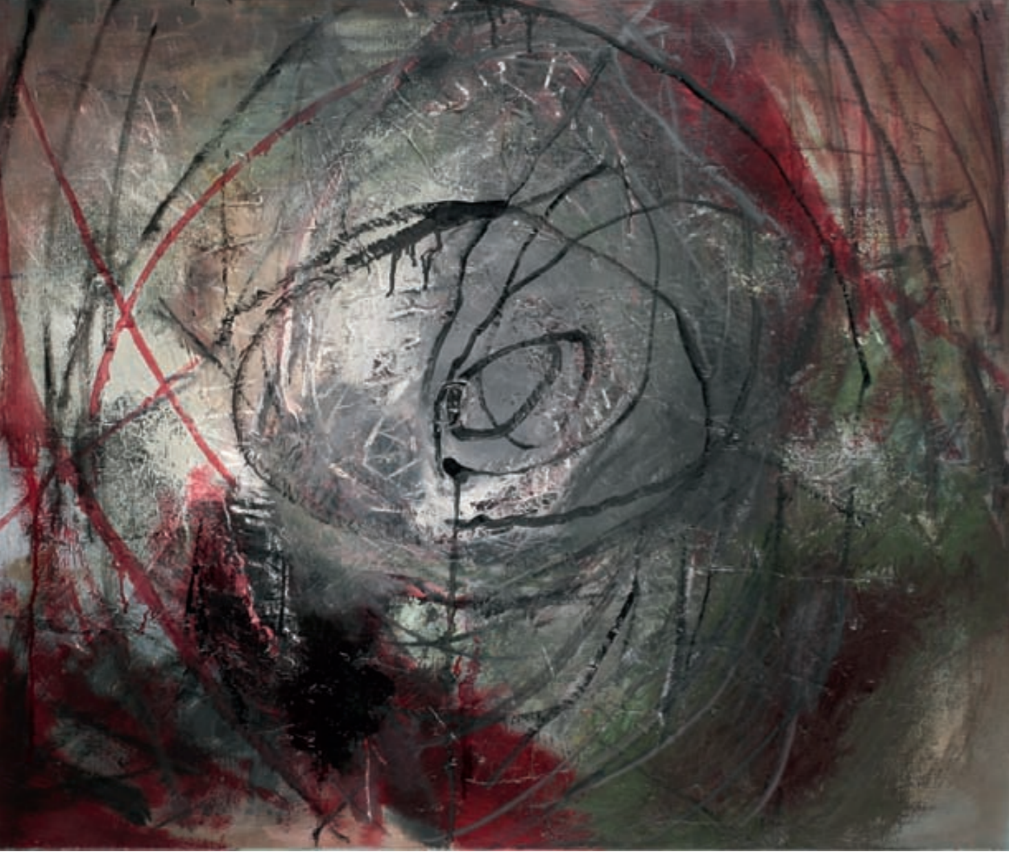
40 HIBISKUS – VERBLÜHT | Przekwitanie, Öl, LEINWAND | olej, płótno, 75x95, 2007