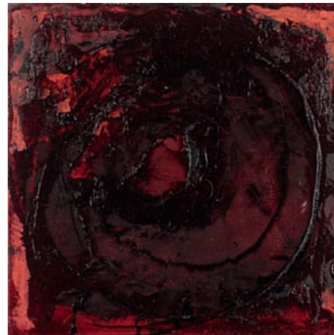
HIBISKUS XI, ÖL, LEINWAND | olej, płótno, 25x25, 2007