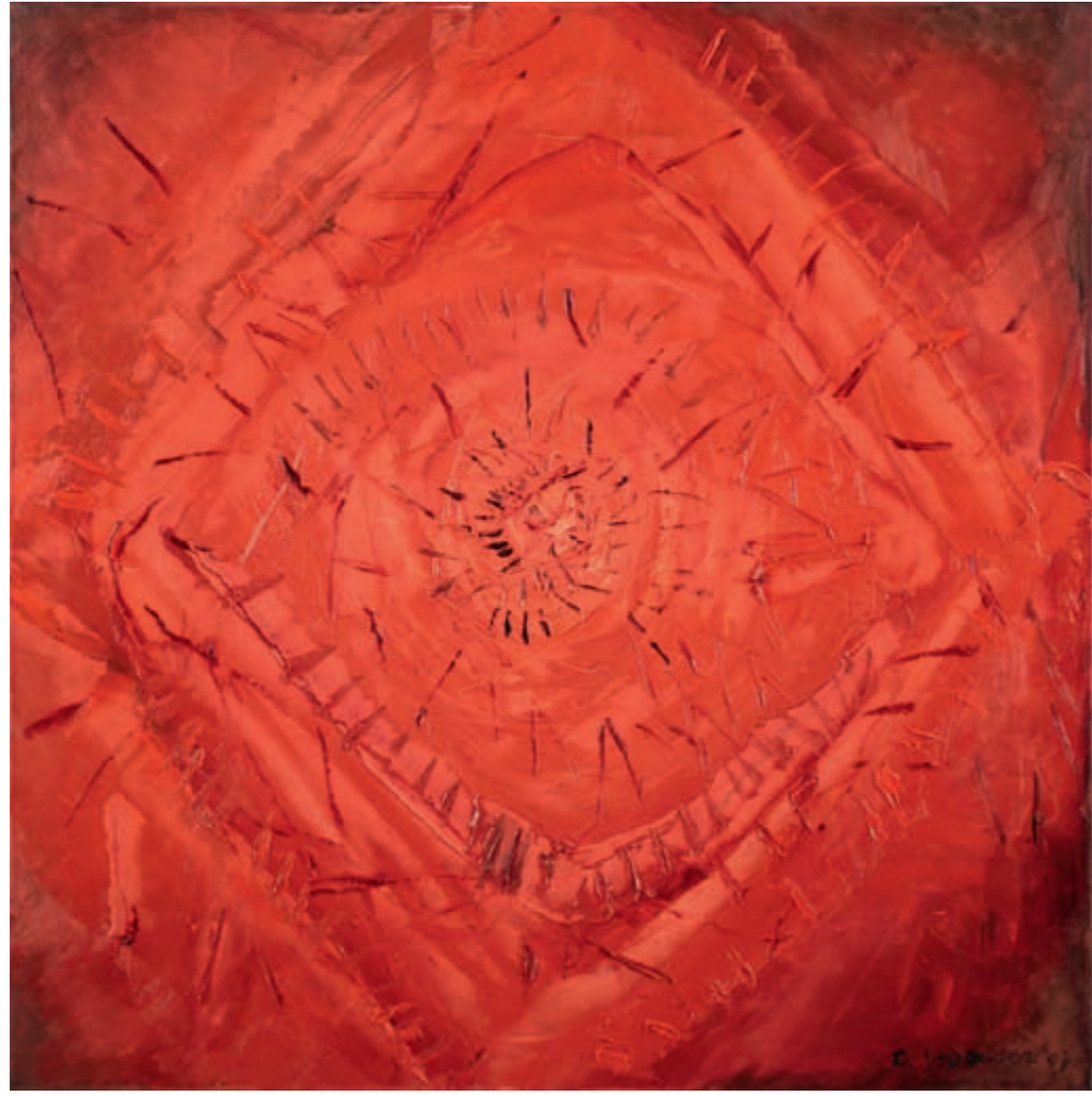
42 HIBISKUS IV, ÖL, LEINWAND | olej, płótno, 80x80, 2007