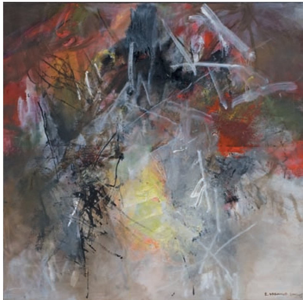
OHNE TITEL | Bez tytułu, ÖL, LEINWAND | olej, płótno, 130x130, 2002