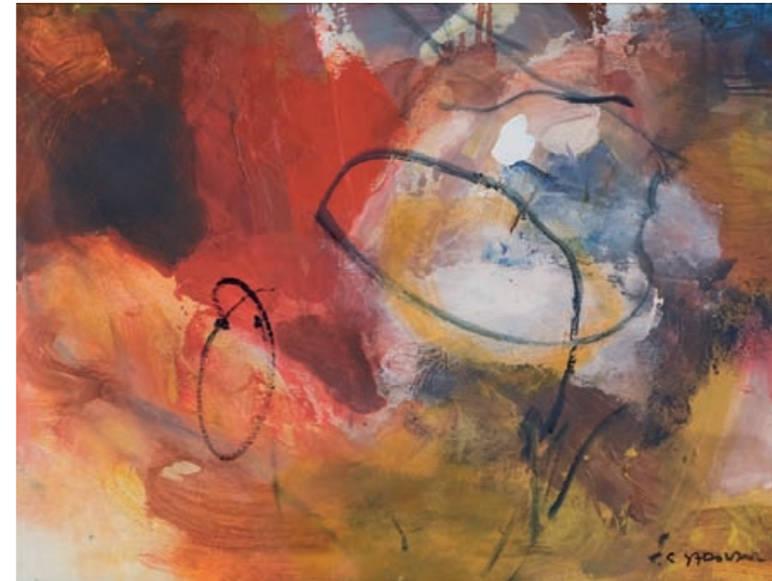
OHNE TITEL | Bez tytułu, Öl, LEINWAND | olej, płótno, 45x61, 2000