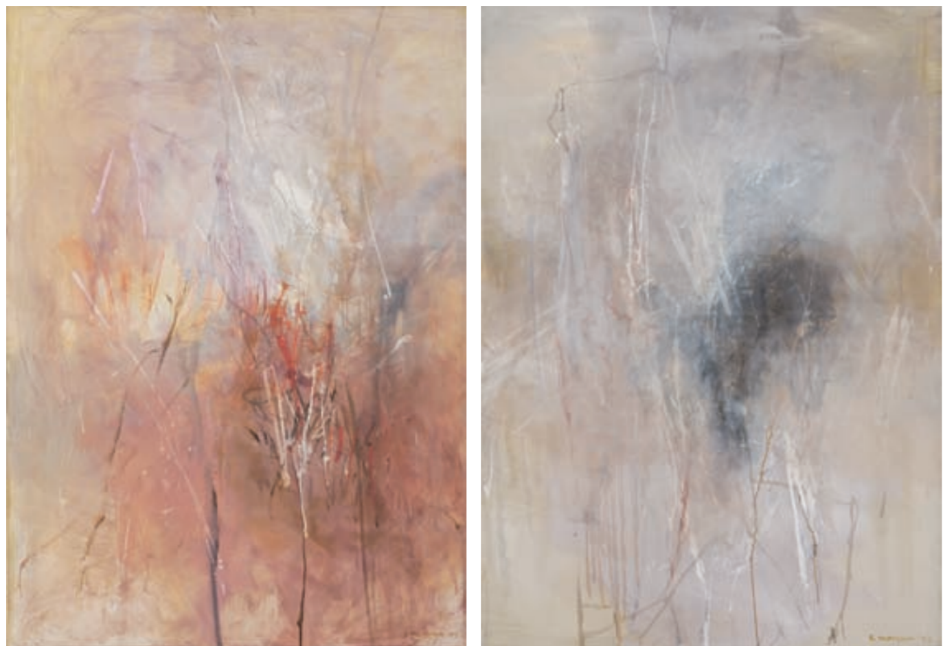
DIPTYCHON SOMMER – WINTER | Dyptyk Lato – Zima ÖL, LEINWAND | olej, płótno, 140x100, 2003 Privatsammlung | wł. prywatna