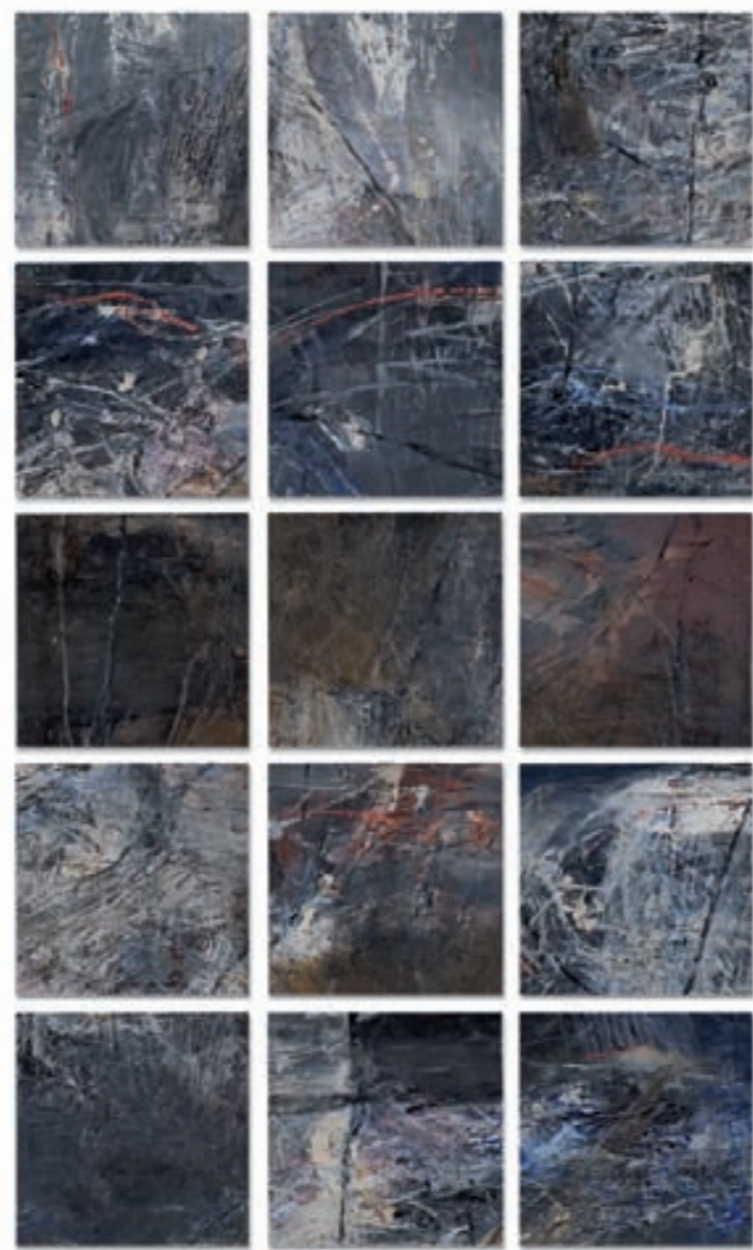
PLANET | Planeta, ÖL, LEINWAND, HOLZ | olej, płótno, drewno, 140x88, 2004