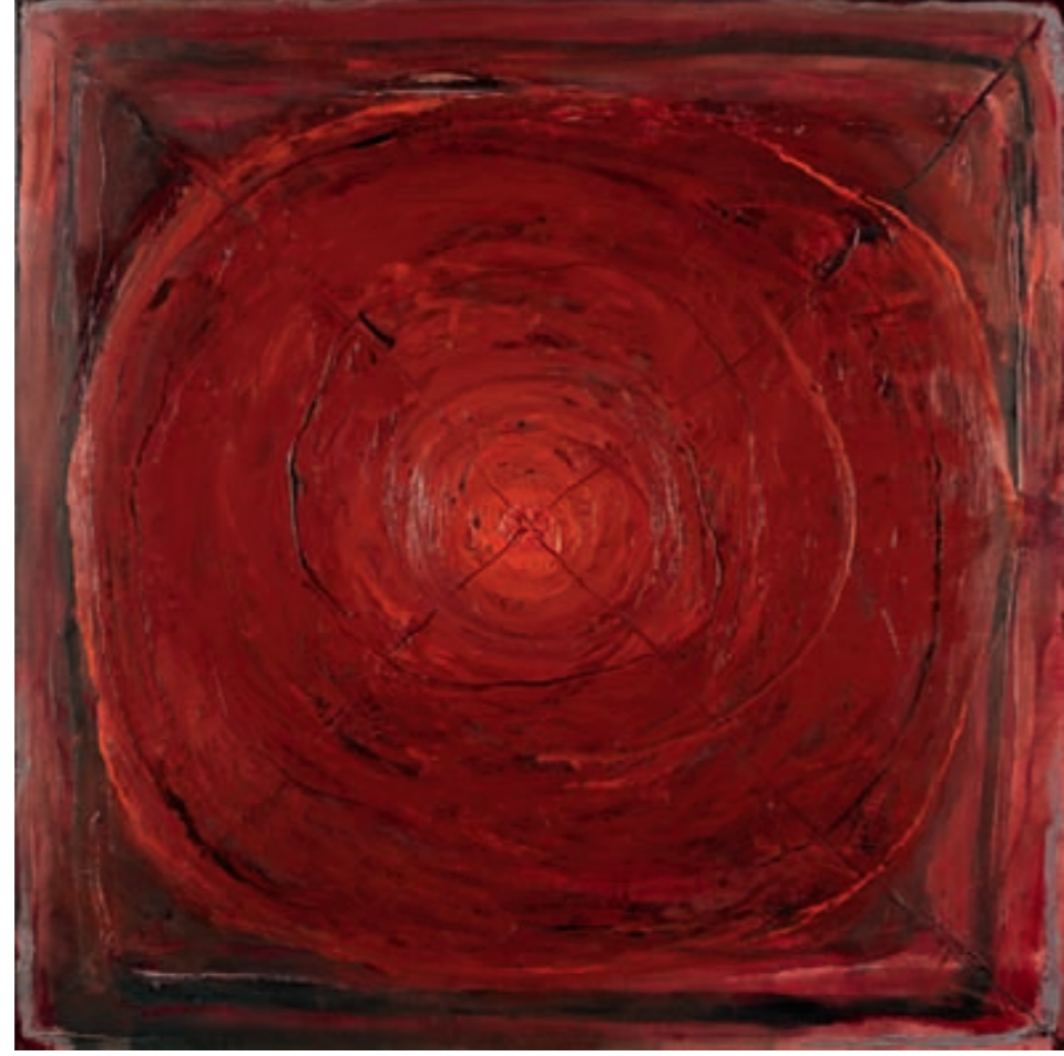
HIBISKUS XX – ROTER KREIS AUF ROTEM HINTERGRUND

50 Czerwone koło na czerwonym tle, Öl, LEINWAND | olej, płótno, 100x100, 2008