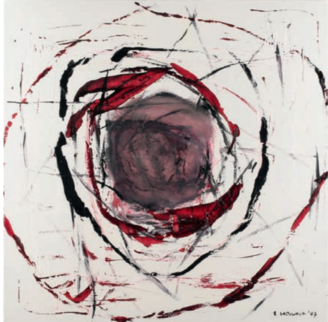
HIBISKUS VI, ÖL, LEINWAND | olej, płótno, 100x100, 2007