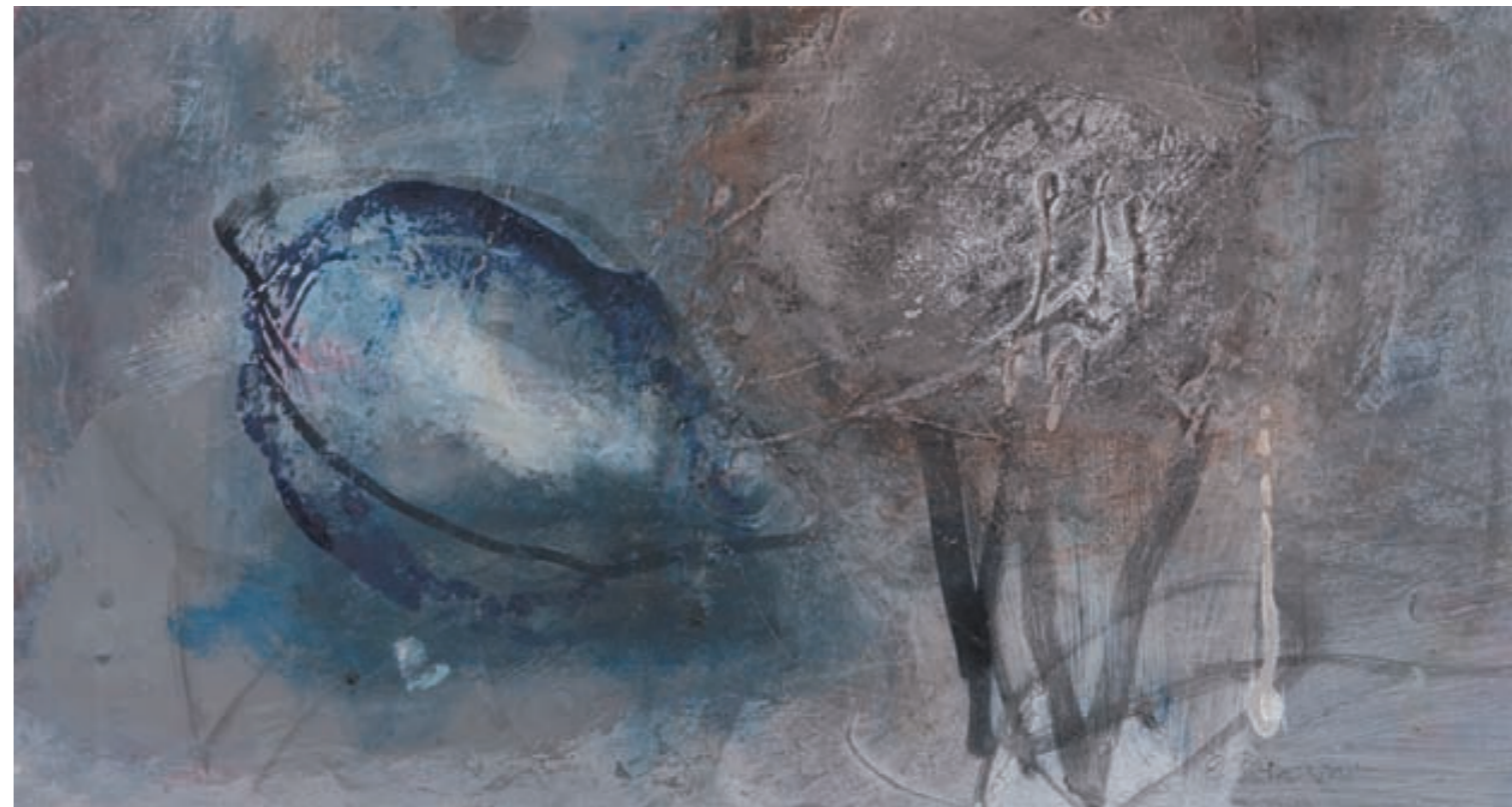
KOMPOSITION | Kompozycja, PAPIER, GOUACHE | papier, gwasz, 42x22, 2003