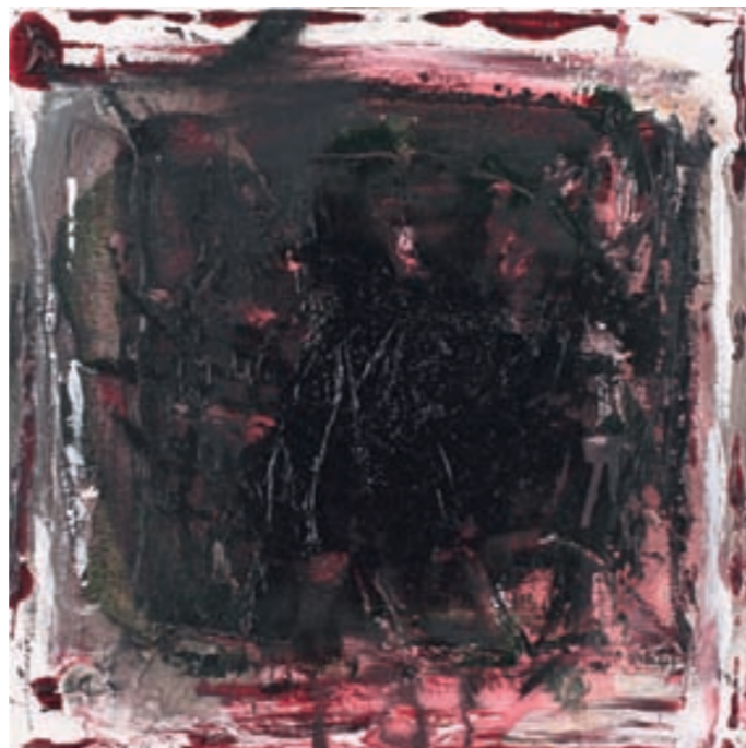
HIBISKUS XIII, ÖL, LEINWAND | olej, płótno, 25x25, 2007