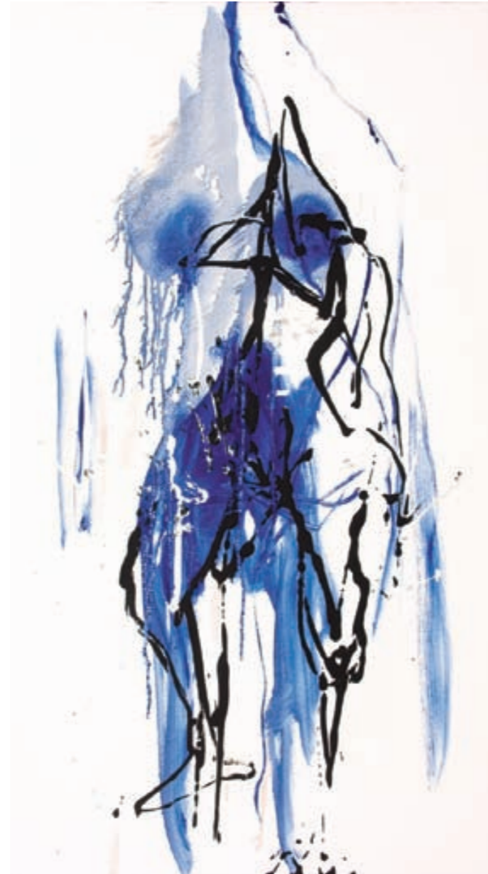
AUSSERHALB II | Poza II, Öl, LEINWAND | olej, płótno, 120x70, 2005