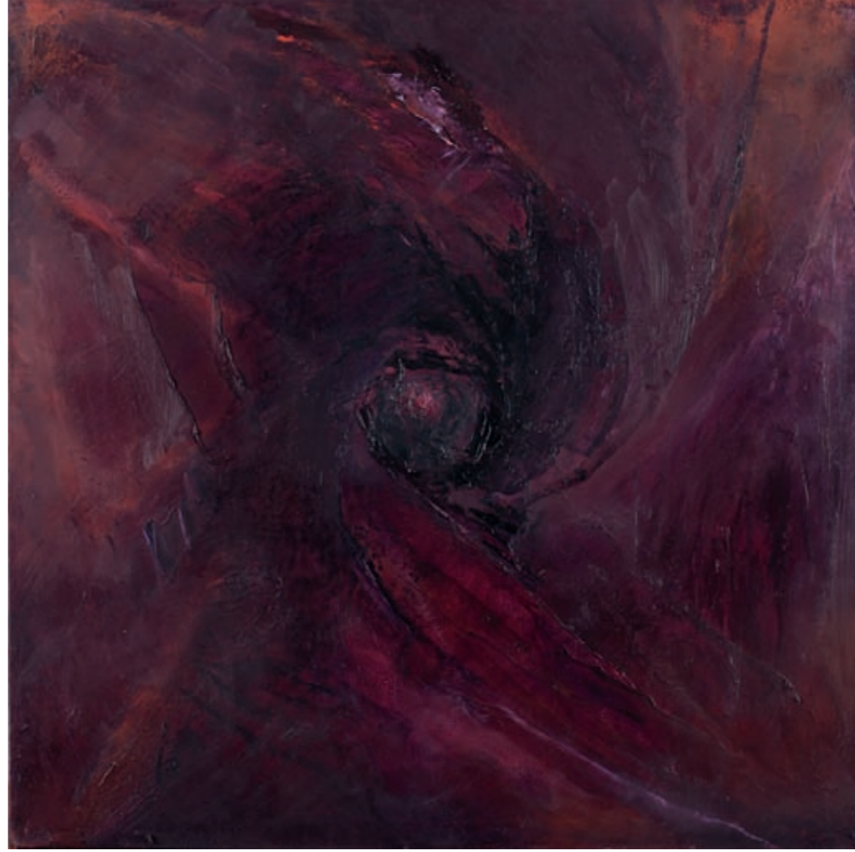
HIBISKUS VII, Öl, LEINWAND | olej, płótno, 60x60, 2007