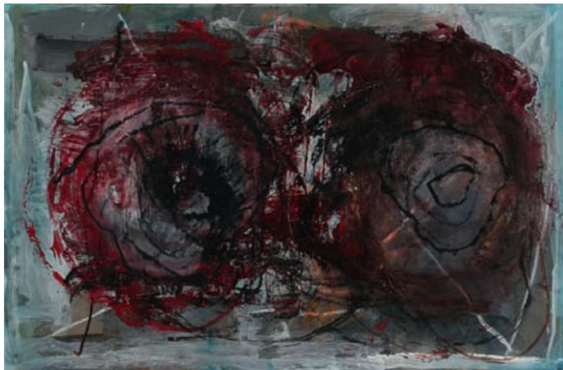
KOMPOSITION | Kompozycja, MISCHTECHNIK, PAPIER | technika mieszana, papier, 36x55, 2008