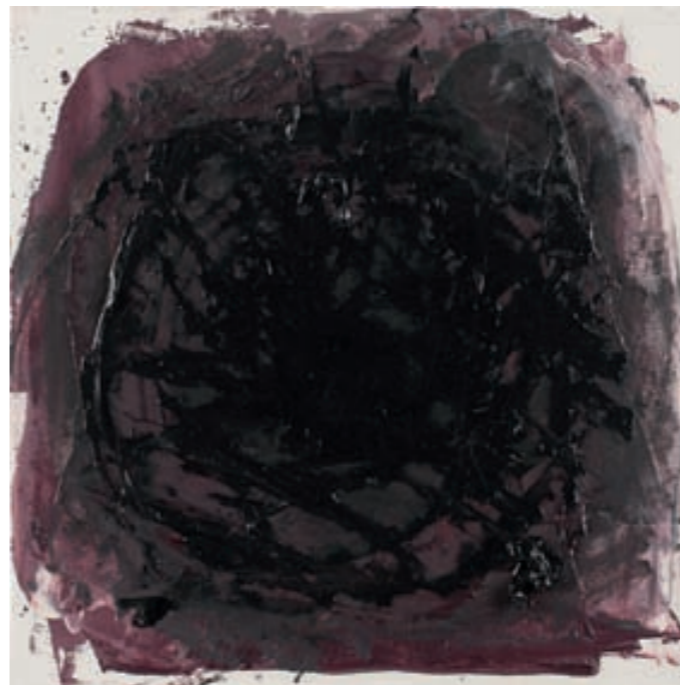
HIBISKUS XII, ÖL, LEINWAND | olej, płótno, 25x25, 2007