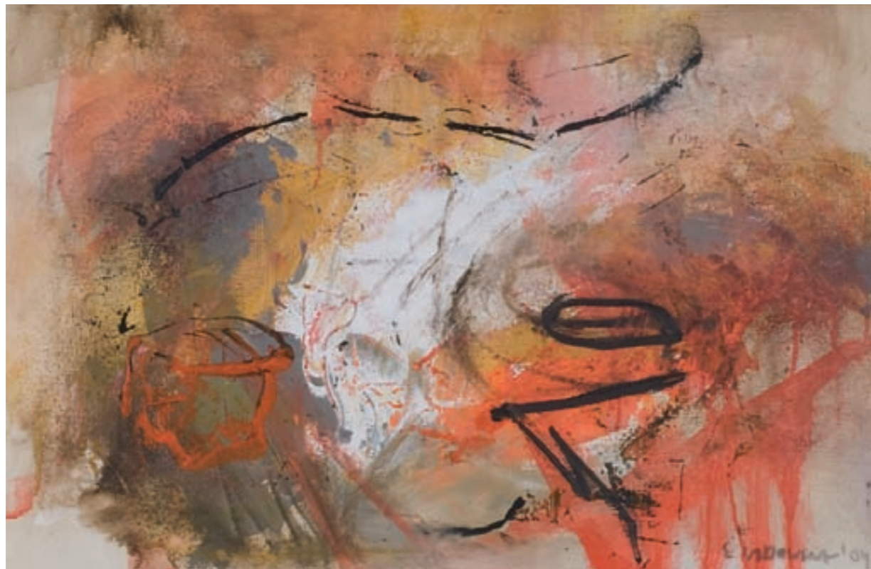
KOMPOSITION | Kompozycja, ÖL, LEINWAND | olej, płótno, 45x61, 2000