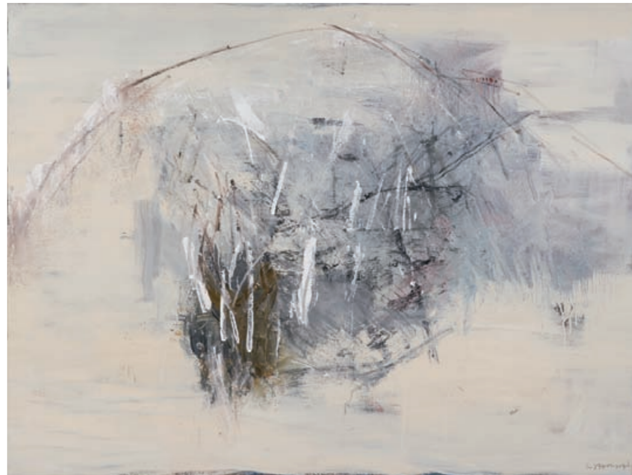
BERG | Góra, ÖL, LEINWAND | olej, płótno, 120x160, 2006 Privatsammlung | wł. prywatna