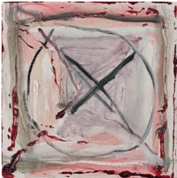
HIBISKUS XIV, ÖL, LEINWAND | olej, płótno, 25x25, 2007