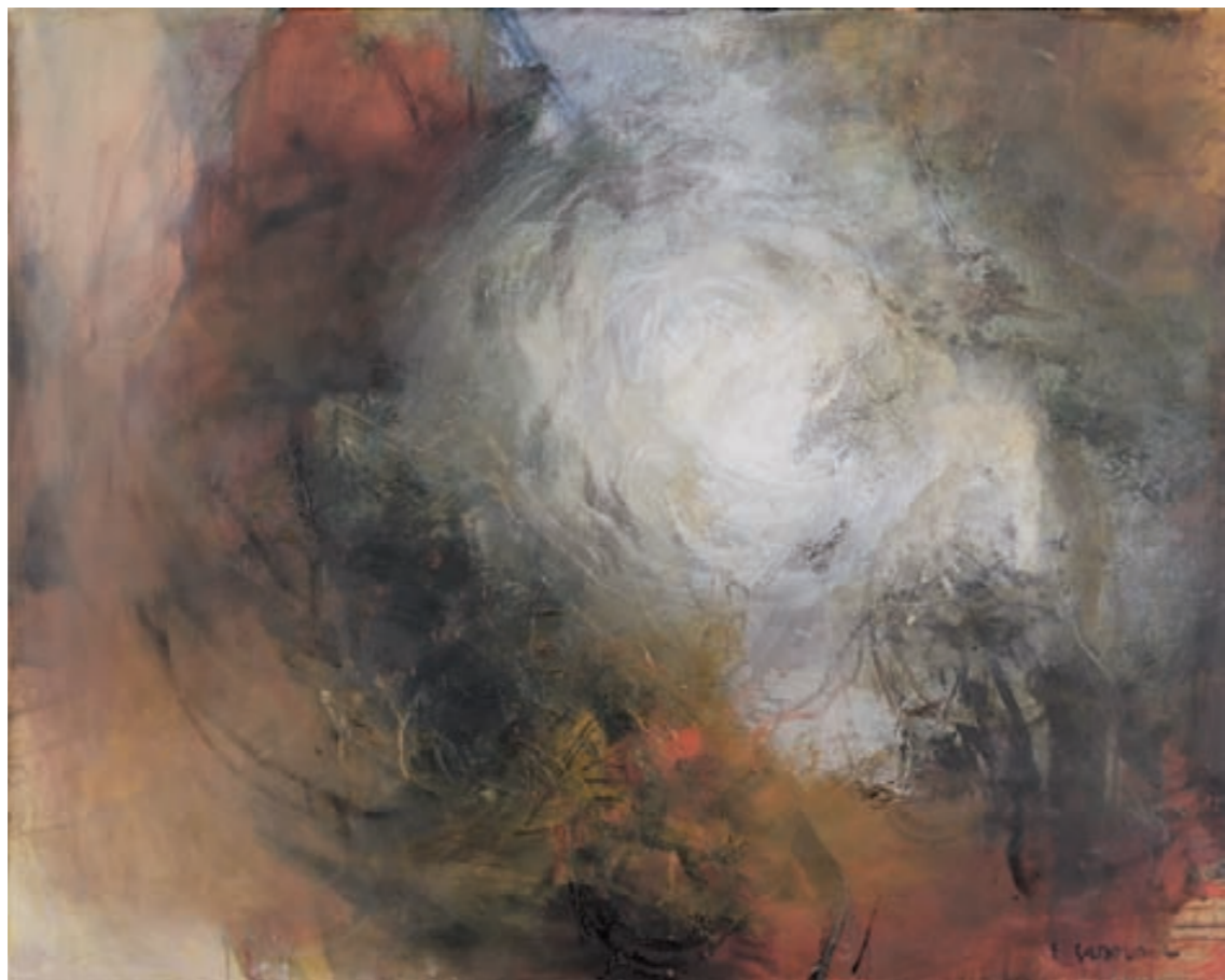
NEBELSCHLEIER | Mgławica, Öl, LEINWAND | olej, płótno, 80x100, 2002