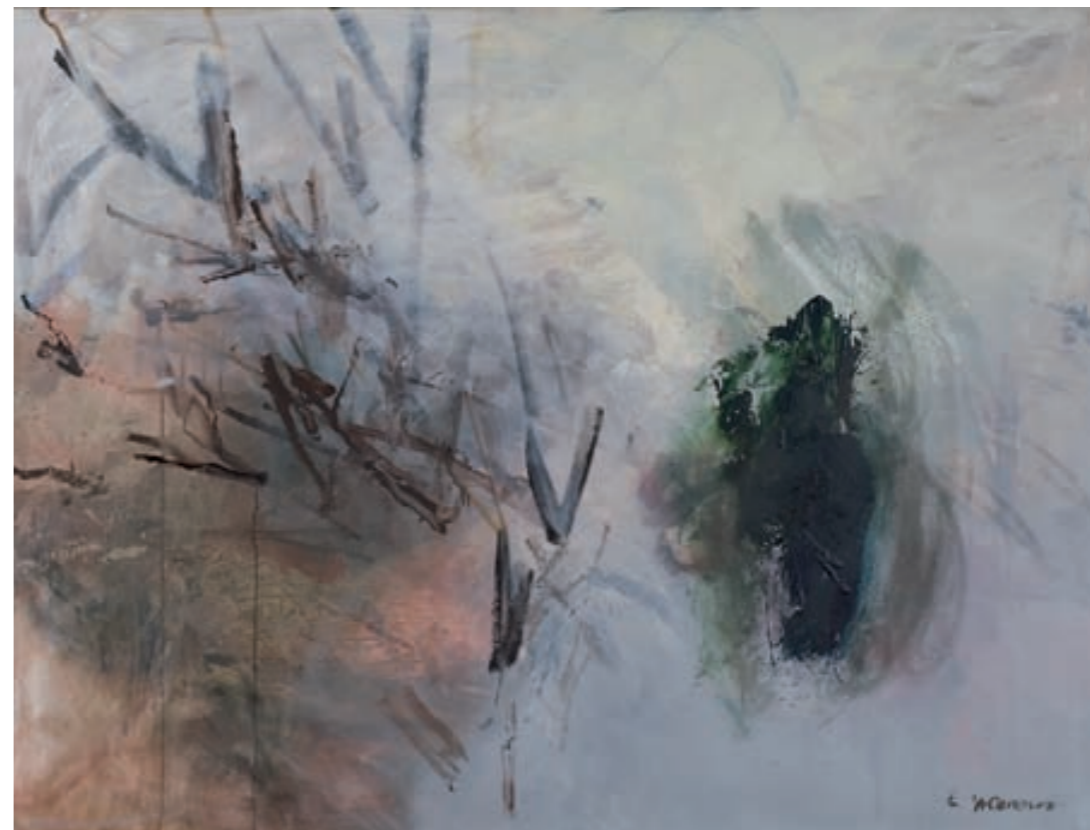
VÖGEL | Ptaki, ÖL, LEINWAND | olej, płótno, 90x120, 2002