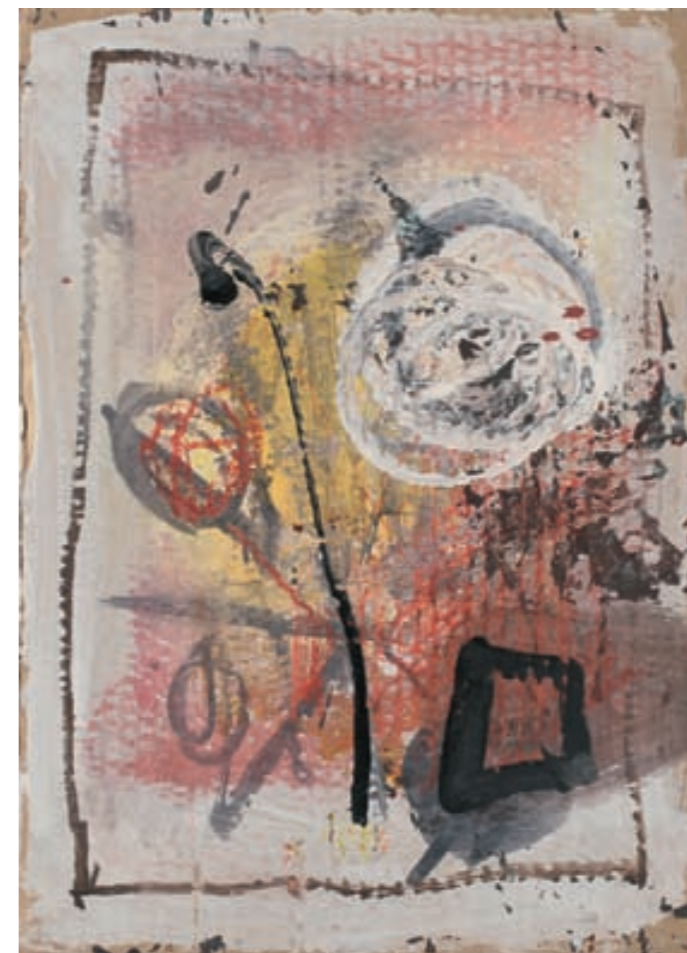
KOMPOSITION | Kompozycja, MISCHTECHNIK, PAPIER | technika mieszana, papier, 35x25, 2007