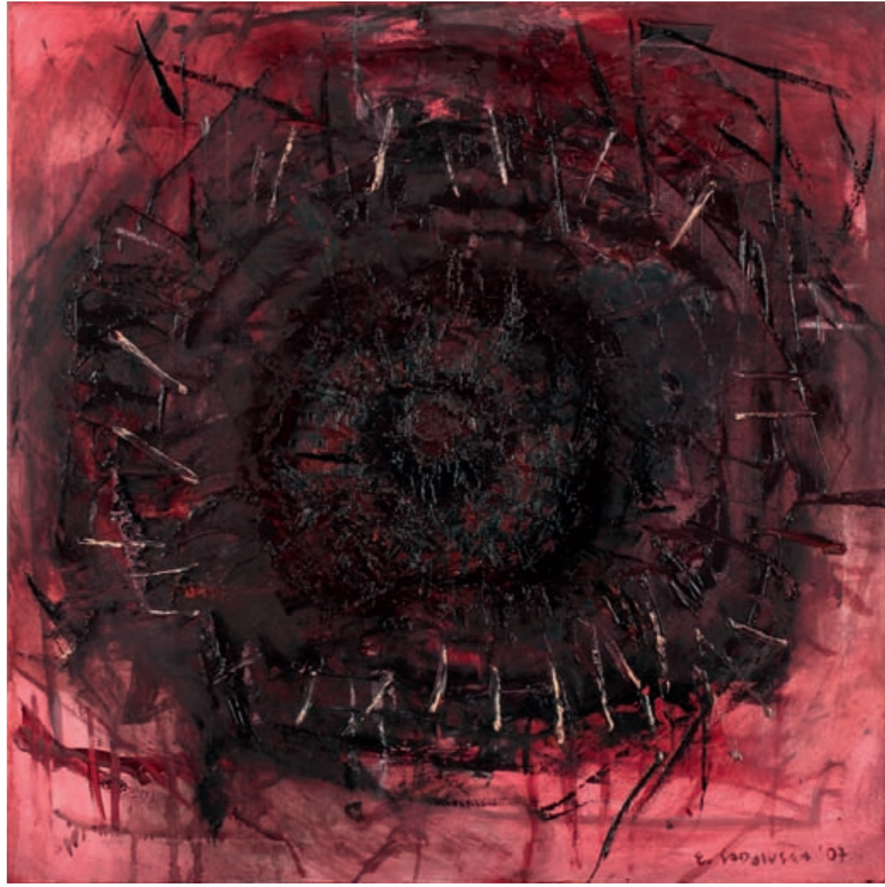
43 HIBISKUS III, ÖL, LEINWAND | olej, płótno, 80x80, 2007