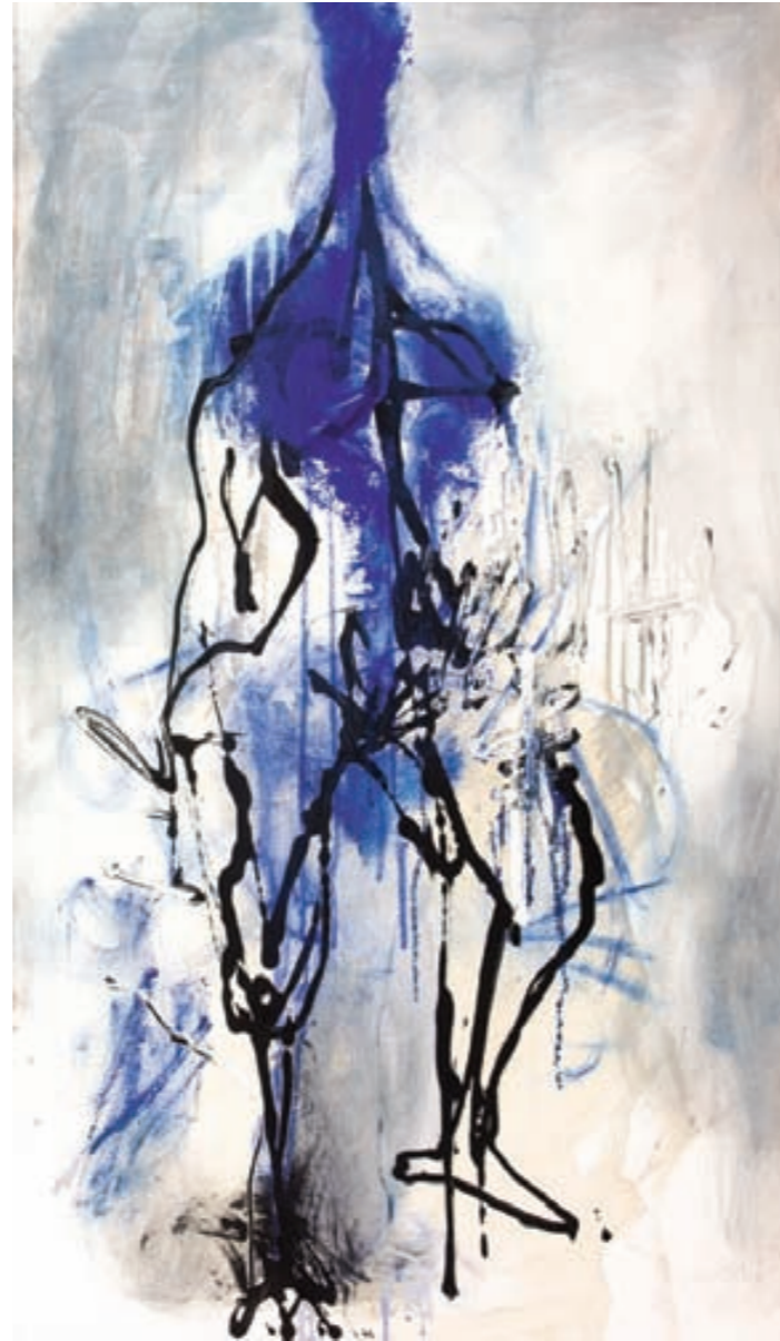
AUSSERHALB I | Poza I, Öl, LEINWAND | olej, płótno, 120x70, 2005 ◀ DEEP BLUE | Otchłań, Öl, LEINWAND | olej, płótno, 166x100, 2003