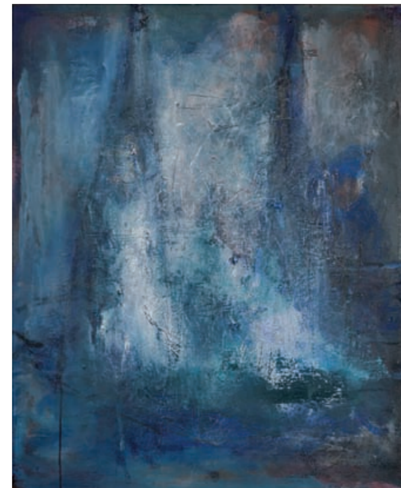
DIE BLAUE KATHEDRALE (DER DOM ZU KÖLN) | Błękitna Katedra

ÖL, LEINWAND | olej, płótno, 93x77, 2004 FDP-Fraktion in der Landschaftsversammlung Rheinland in Köln.