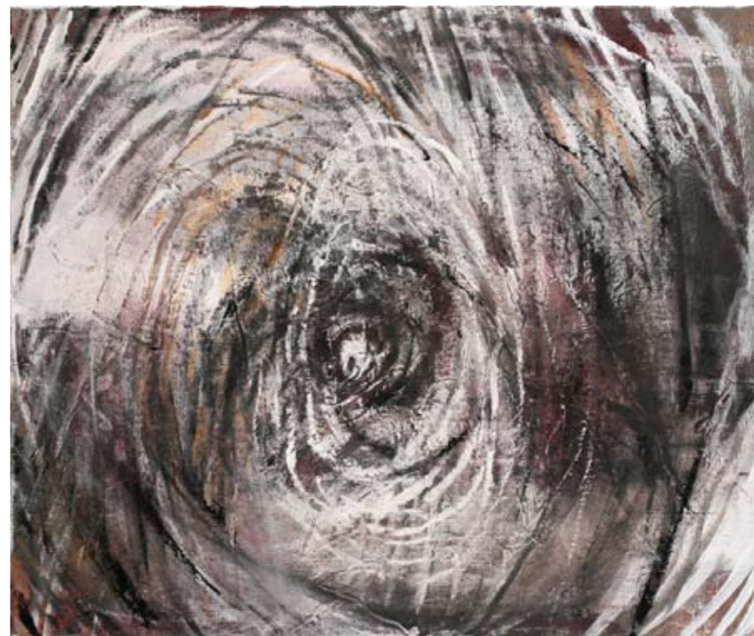
HIBISKUS – AUFGEBLÜHT | Rozkwit, ÖL, LEINWAND | olej, płótno, 75x95, 2007