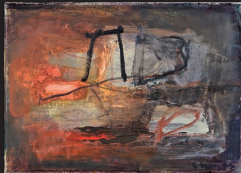
LANDSCHAFT | Pejzaż, Öl, LEINWAND | olej, płótno, 27x38, 2001 Privatsammlung | wł. prywatna ▶