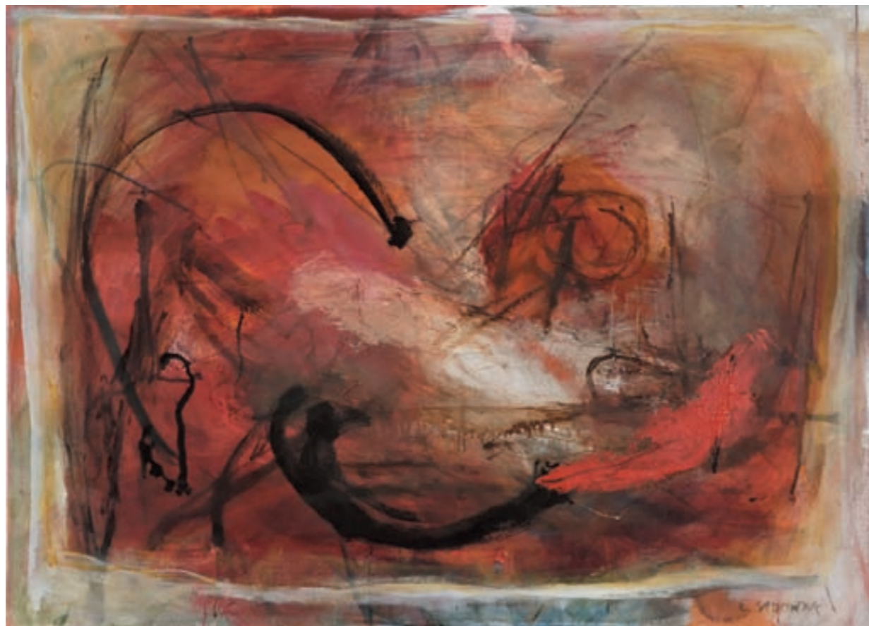
SCHARLACHROTE ENERGIE (FÜR DARIA) | Szkarłatna energia (dla Darii)

ÖL, LEINWAND | olej, płótno, 80x110, 2004 Privatsammlung | wł. prywatna