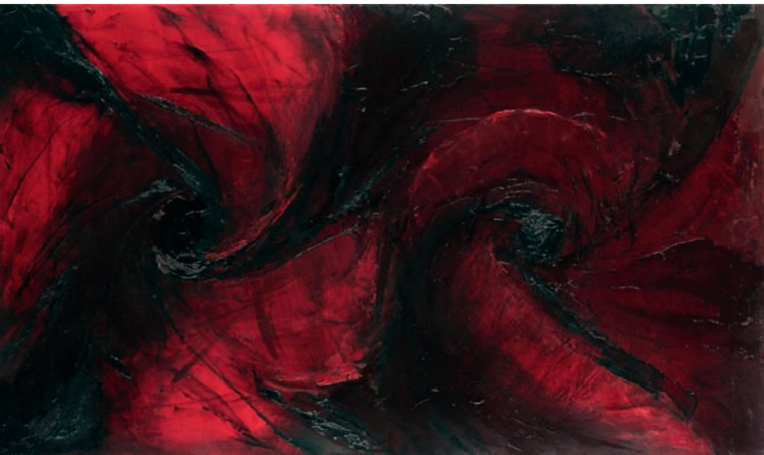
HIBISKUS X – WIRBEL | Wiry, ÖL, LEINWAND | olej, płótno, 70x120, 2007